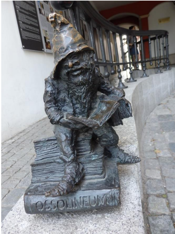
Foto allikas: Lepik, K. 2019, erakogu Vastus: Ossolinek, loeb Wroclawis raamatut. Allikas: http://krasnale.pl/krasnal/ossolinek/ või http://krasnale.pl/en/krasnal/ossolineo/